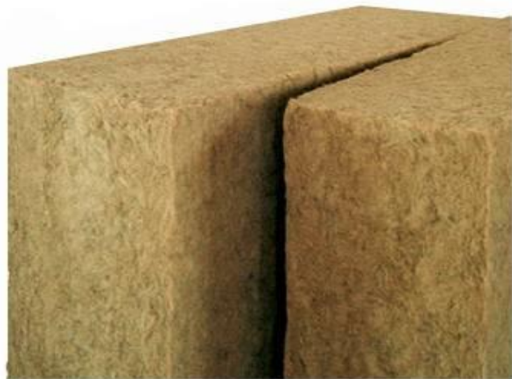
Naturaflex (50Kg/mc c=2100\text{J/KgK} )