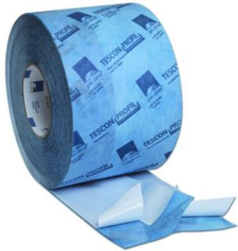
Proclima TESCO PROFIL